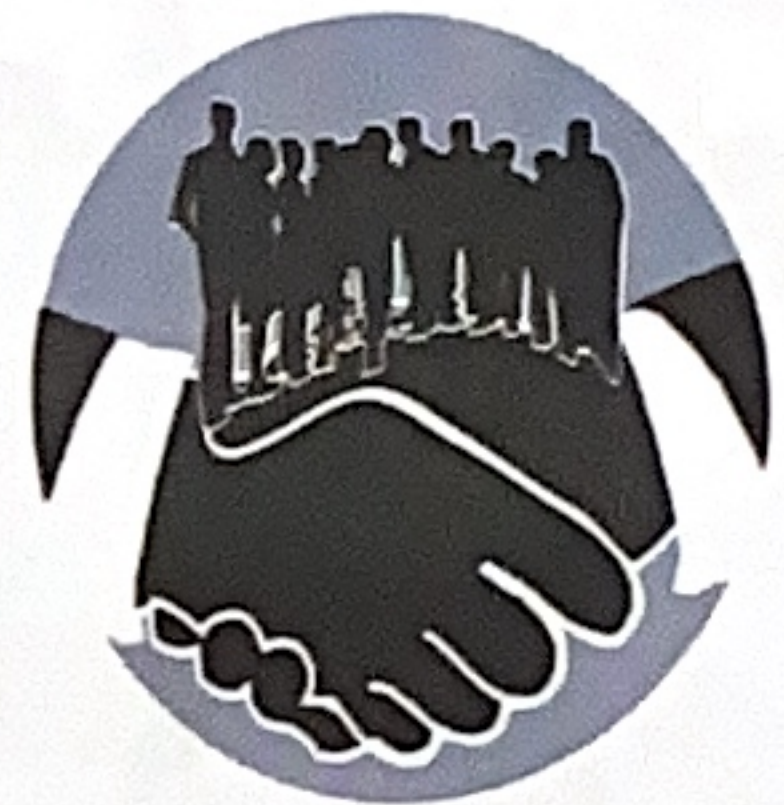
3 creación de sindicatos conservadores como a UTC.