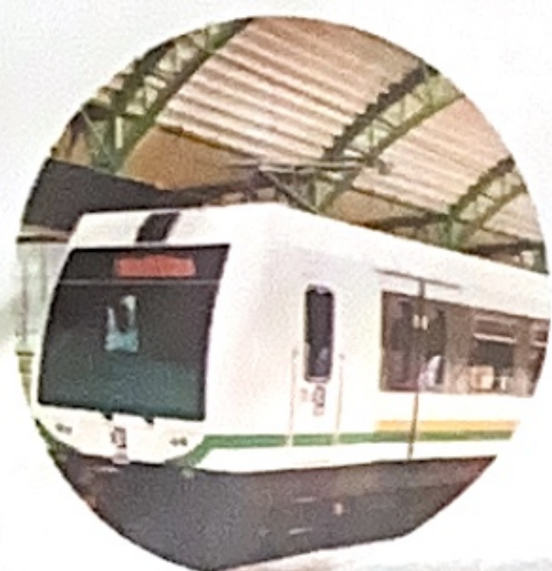
6. Inicio Metro de Medellín.