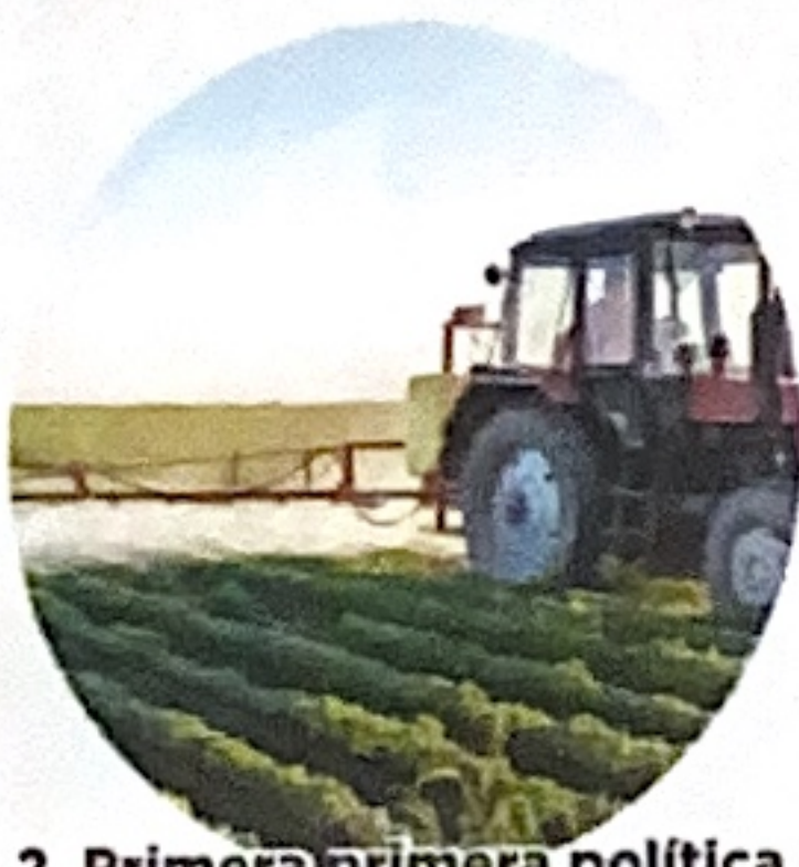
2. Primera primera política de adjudicación de baldíos a campesinos.