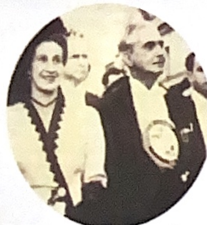
5. Primera Mujer Senadora Bertha Hernández de Ospina