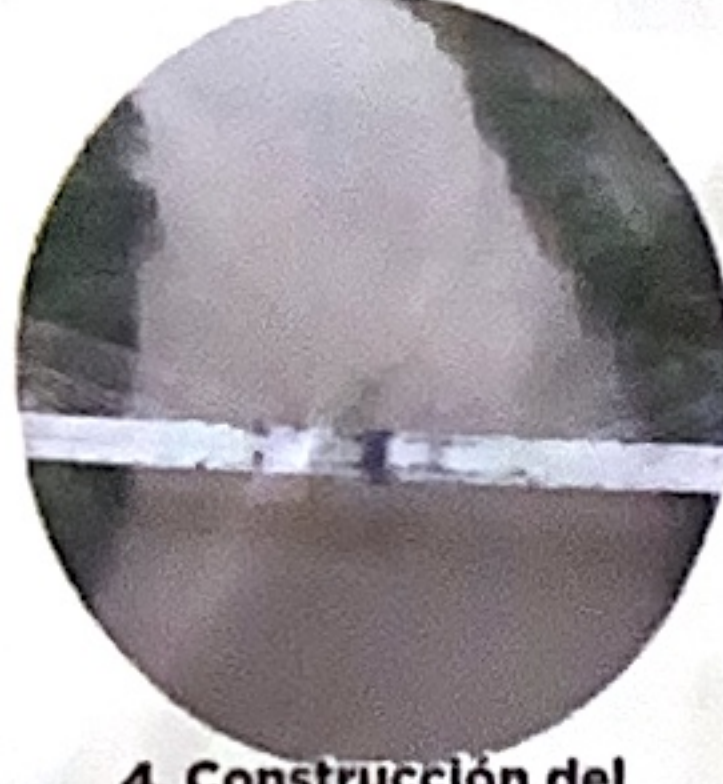
4. Construcción del puente de Honda sobre el Río Magdalena.