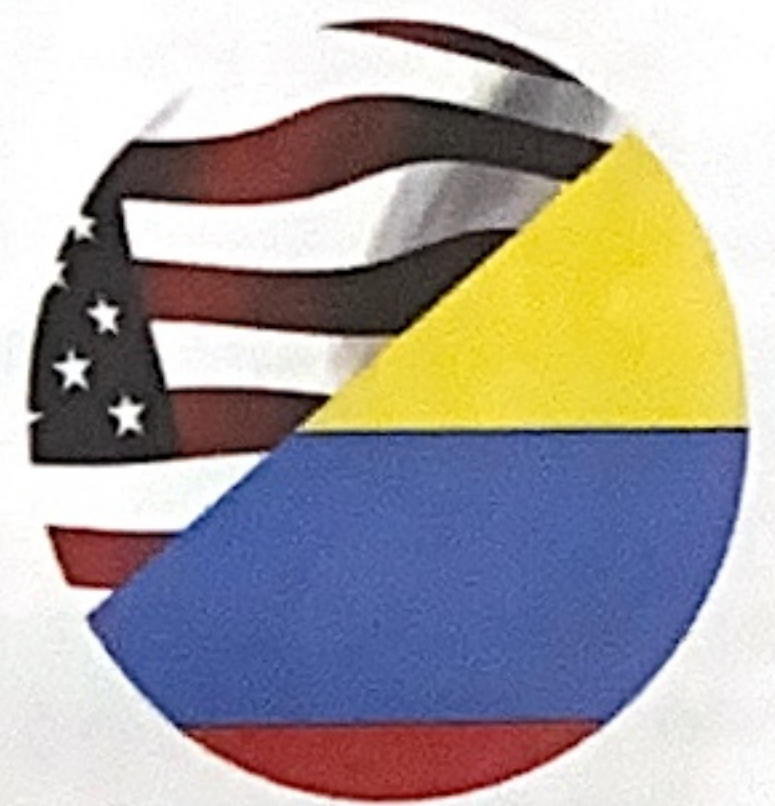
5. Creación plan Colombia.