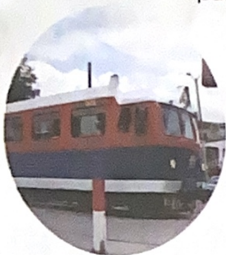
2. Fortalecimiento de Infraestructura de Ferrocarriles.